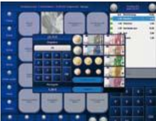
Barrechnung / Wechselgeld